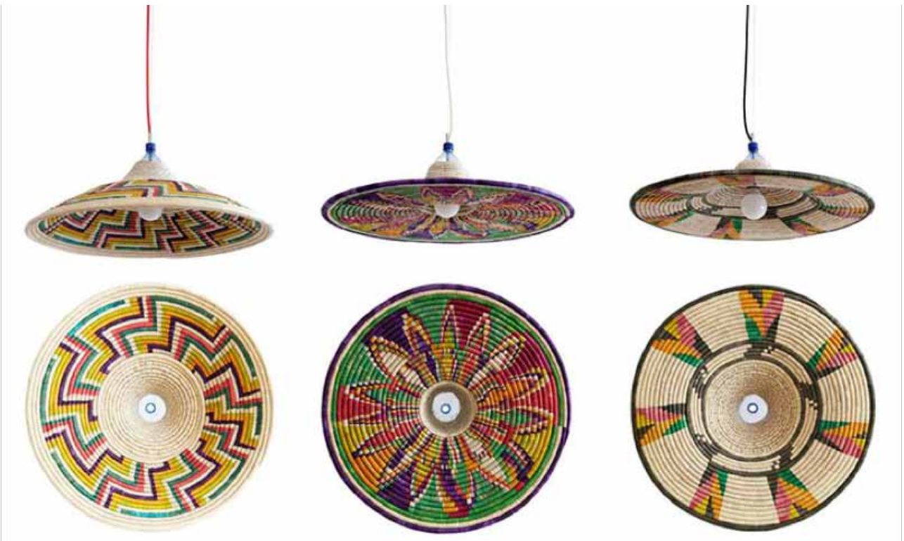
PETLamp - gemaakt uit PETflessen

Een ander project dat te denken gaf, was PET Lamp. Dit Spaanse initiatief reisde de afgelopen vijf jaar de continenten af en liet mensen lampen weven van gebruikte petflessen, werkend vanuit hun lokale tradities. In Milaan presenteerde PET Lamp de resultaten van een samenwerking met de Aboriginals in Australië.