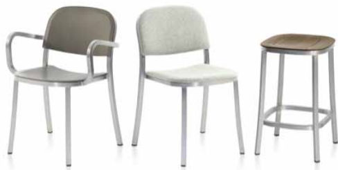
1 Inch - Jasper Morrison voor Emeco

Boeiend was het uitwisselingsproject tussen twee opleidingen uit Kyoto en Singapore. De studenten stuurden elkaar foto's van hun dagelijkse omgeving en namen die als uitgangspunt voor nieuw werk. Ook hier weer dat superieure gevoel voor materiaal en detaillering. Dit project was te zien op Ventura Futura, onderdeel van het nieuw opgezette Ventura: niet meer in de afgelegen buitenwijk Ventura, maar in de buurt rond het Centraal Station. In de imponerende tongewelven onder het station (Futura Centrale) overtuigde vooral de presentatie van Eileen Fischer. Dit Amerikaanse modebedrijf zamelt eigen kledingstukken in en vervult die tot fraai-ge-laagde kussens, dekens en wandtapijten. Je ziet de kledingstukken en sjaals er soms nog in terug.