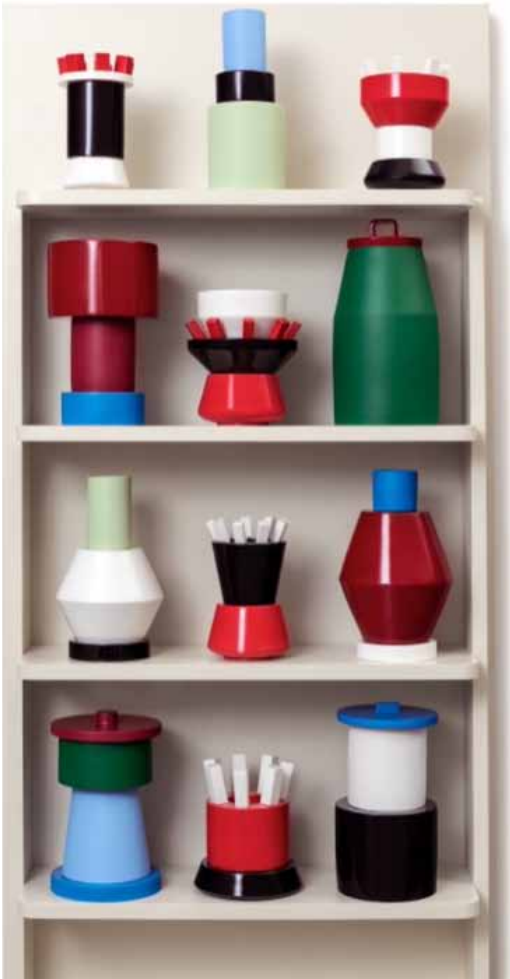
Keramik van Nathalie du Pasquier en George Sowden voor galerie Post Design