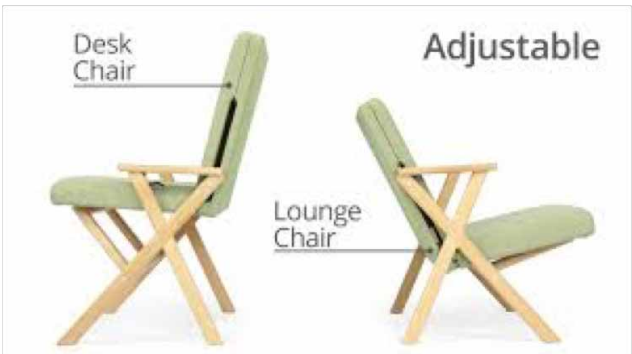
verstelbare fauteuil Sander Lorier

Studio Sander Lorier verraste met een soepel verstelbare fauteuil. Opmerkelijk was Not for sale van de Design Academy dat haar ontwerpen onopvallend ‘verstoep’ presenteerde, onder meer in een markthal. De presentatie van Dutch Invertuals heb ik jammergenoeg niet kunnen bezoeken. Milaan is eenvoudigweg te groot.