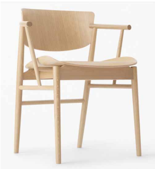
NO1 - Nendo voor Fritz Hansen

De voormalige Memphisleden Nathalie Du Pasquier en George Sowden, beiden inmiddels de zestig gepasseerd, toonden nieuwe meubels, vazen en tapijten. Fris werk in de Memphis traditie dat soms erg dicht tegen Memphis-oprichter Ettore Sottsass aanleunt.