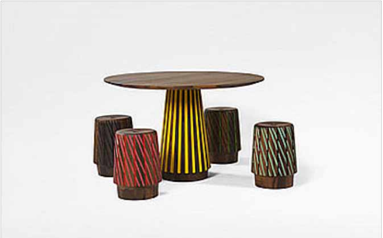
Sefefo collectie - Patrizia Urquiola voor Mabeo

Een ander project dat te denken gaf, was PET Lamp. Dit Spaanse initiatief reisde de afgelopen vijf jaar de continenten af en liet mensen lampen weven van gebruikte petflessen, werkend vanuit hun lokale tradities. In Milaan presenteerde PET Lamp de resultaten van een samenwerking met de Aboriginals in Australië.