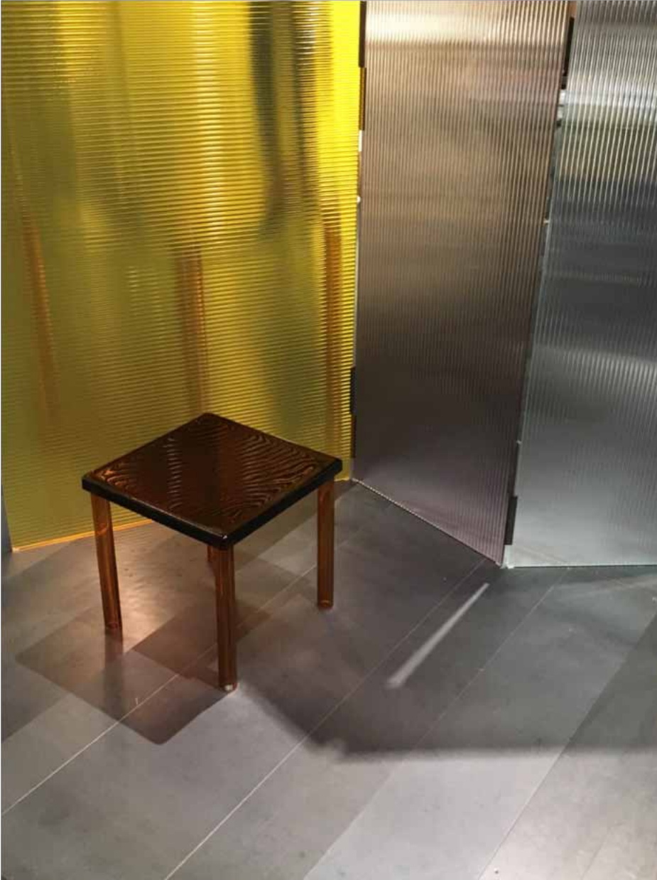
Kamerscherm en tafeltje - Ronan & Erwan Bouroullec voor Glas Italia

Het mooiste in Milaan betref een eeuwenoud materiaal: glas. Diverse bedrijven gebruikten dit zo intelligent dat traditie en vernieuwing opwindend samengaan.. Glas Italia weet eigentijdse ontwerpers te inspireren tot een veelzijdige en volwassen collectie. Variërend van originele tafeltjes van Tokujin Yoshioka tot verfijnde, glazen kamerschermen van de gebroeders Bouroullec en boekenkasten van Jean Nouvel.