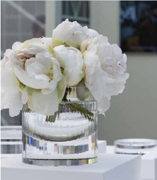
vaas - John Pawson voor Swarovski