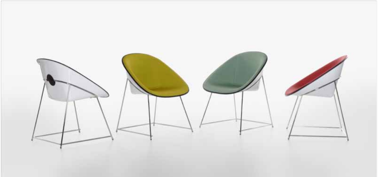
Cup - Konstantin Grcic voor Plank